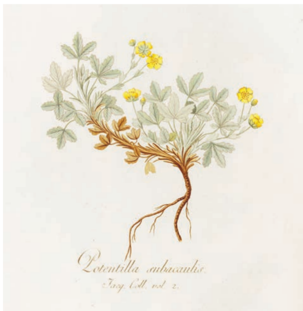
→ Mochma písečná.