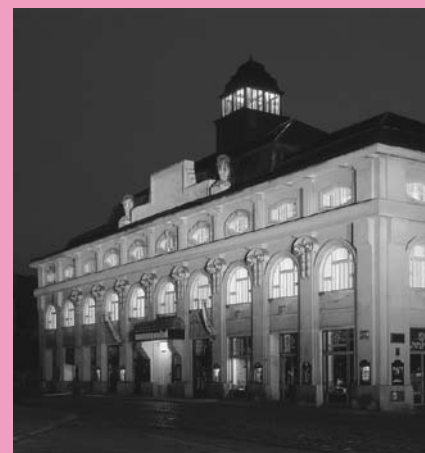
Arcidiecézní muzeum Olomouc