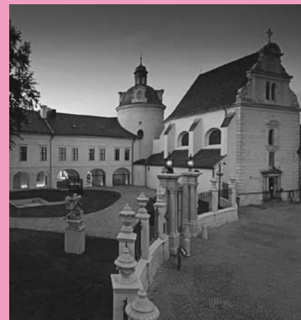
Arcidiecézní muzeum Kroměříž