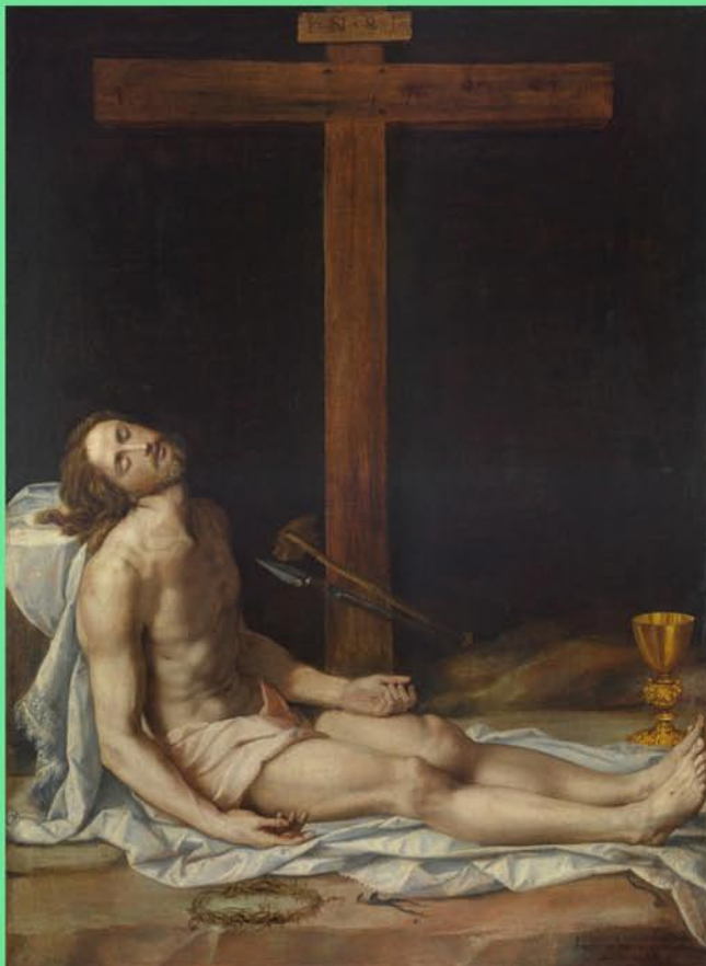
Alessandro Allori, Kristus pod křížem , 1583, Arcidiecézní muzeum Olomouc